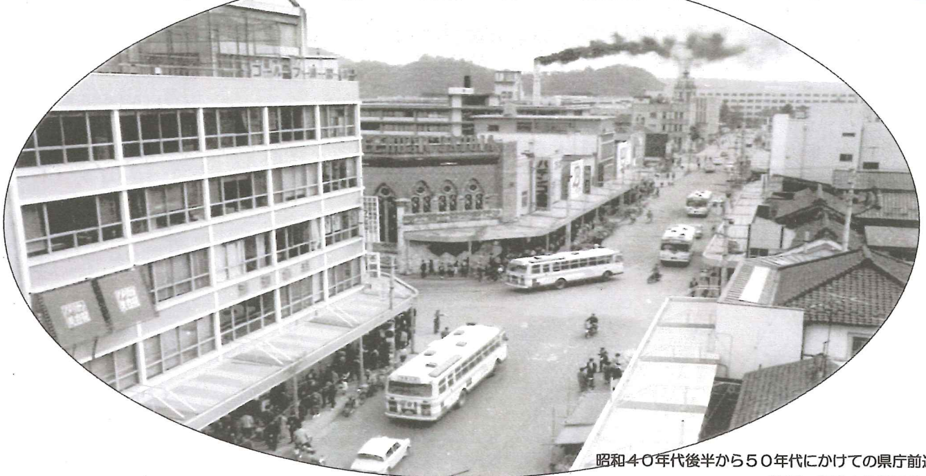
昭和40年代後半から50年代にかけての県庁前通り